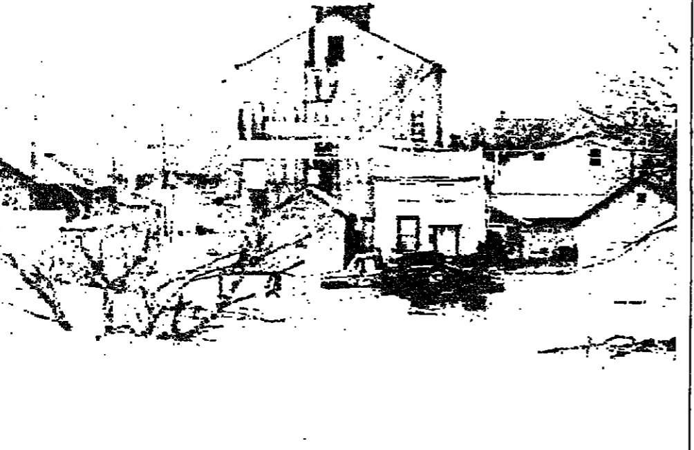
في منتصف الشهر الجاري، هطلت امطار غزيرة فوق ولاية كنتاكي الامريكى، الامر الذي تسبب فيفيضانات كبيرة وبخسائر مالية جسيمة. في الصورة الاولى، الريفية وقد عزلتها المياه بعد ان تجاوزت منسوب نهر الكينيك، المعدل بأحد عشر قدما.